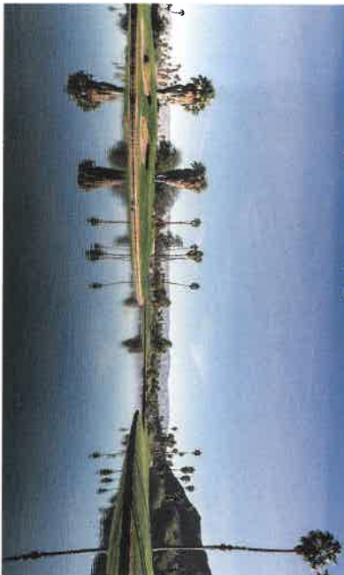
Golf du Rancho Mirage, Westin Palm Springs