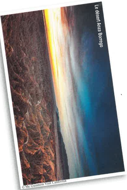
Le désert Anza Borrego