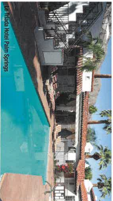
Le Triada Hotel Palm Springs