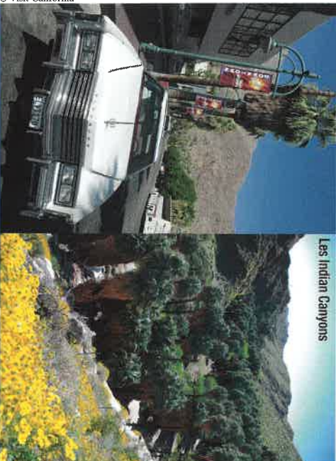
Les Indian Canyons