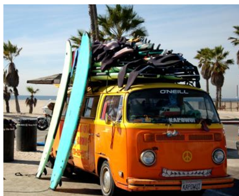
La carte-postale du rêve californien à Venice Beach.

De là, les immenses champs d'éoliennes mènent à Palm Springs. Célèbre pour son festival de rock, cette oasis en