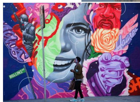
Dans l'Arts District de Los Angeles, quartier en plein renouveau, la plupart des murs sont ornés de graffitis.

La Californie du Sud c'est enfin et surtout la mythique Los Angeles. Une ville impossible à aborder dans son ensemble tant elle est multiple. On ne lui connaît